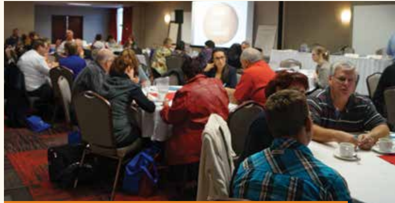
Saturday morning, October 19. Everybody is ready to start!

On October 18 and 19, FFARIQ 2014 symposium and Annual general assembly took place. We had the chance to welcome different speakers and professionals to inform the members on various subjects regarding their role as foster resource.