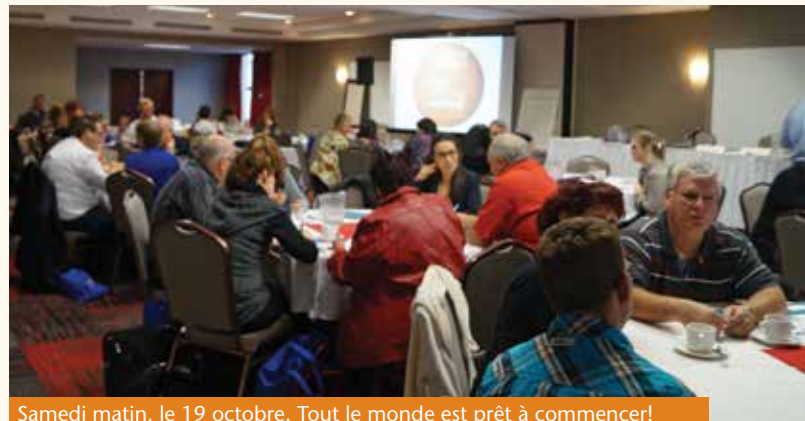
Samedi matin, le 19 octobre. Tout le monde est prêt à commencer!

Le weekend du 18 et 19 octobre dernier a eu lieu le congrès 2014 de la FFARIQ ainsi que son Assemblée générale annuelle. Nous avons eu la chance de recevoir différents conférenciers et professionnels afin d'informer les membres présents sur de nombreux sujets qui nous touchent dans notre rôle de ressource d'accueil au quotidien.