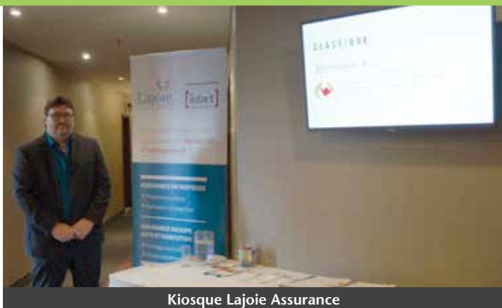
Kiosque Lajoie Assurance