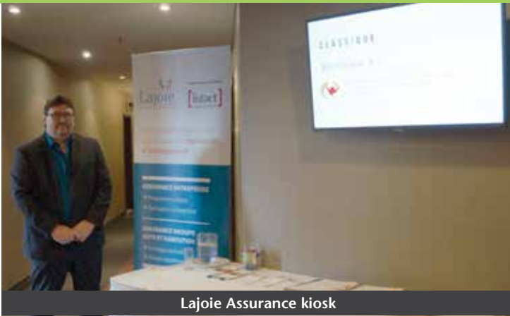
Lajoie Assurance kiosk