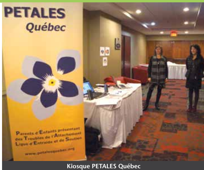
Kiosque PETALES Québec