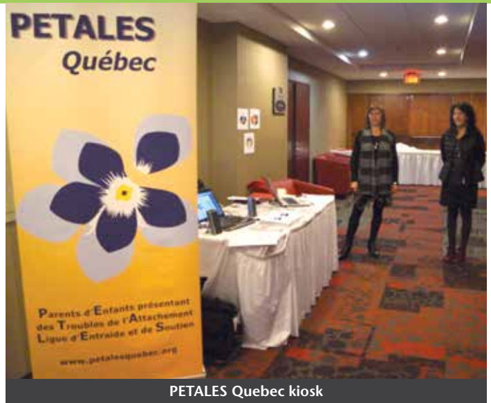
PETALES Quebec kiosk